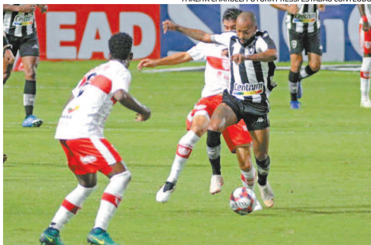
Botafogo não fez boa partida em Maceió e sofreu a virada