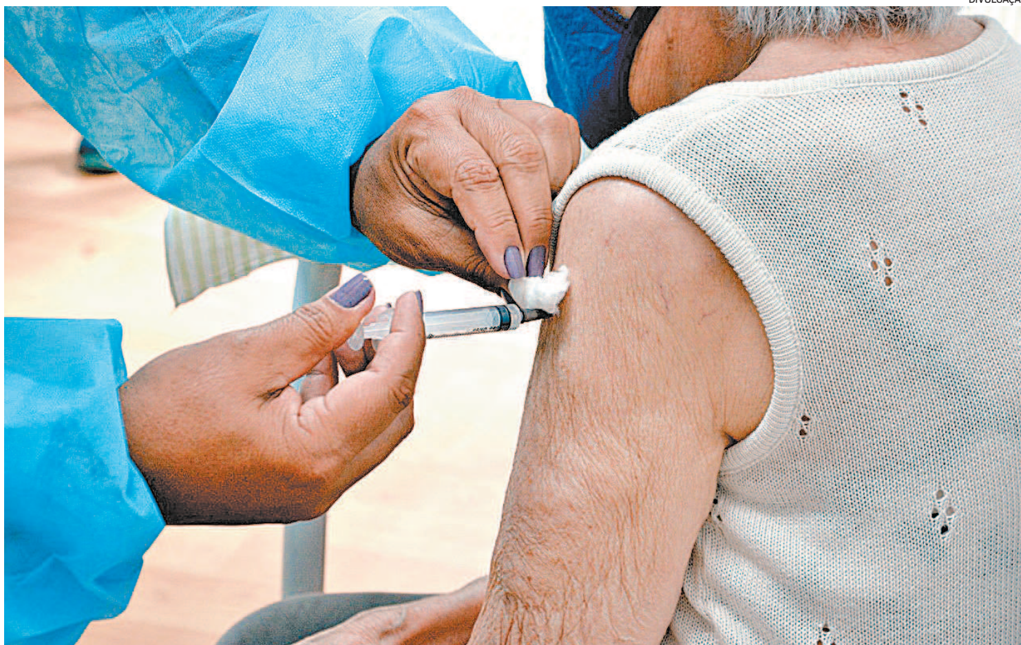
Campanha tem mais de 80 milhões de doses de vacinas influenza contra a gripe produzidas pelo Instituto Butantan, em São Paulo

Fazem parte dos grupos prioritários: pessoas acima dos 60 anos, professores, crianças de seis meses a menores de 6 anos de idade (5 anos, 11 meses e 29 dias), gestantes e puérperas (até 45 dias após o parto), povos indí-