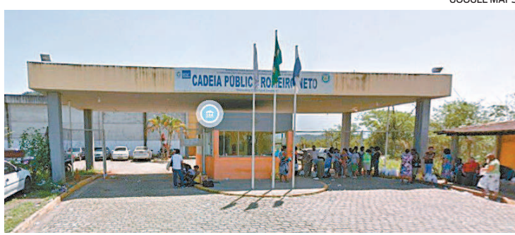
Presídio Romeiro Neto, em Magé, na Baixada Fluminense

Diretor de uma das unidades que teria usado carro oficial para ir ao motel também perdeu o cargo