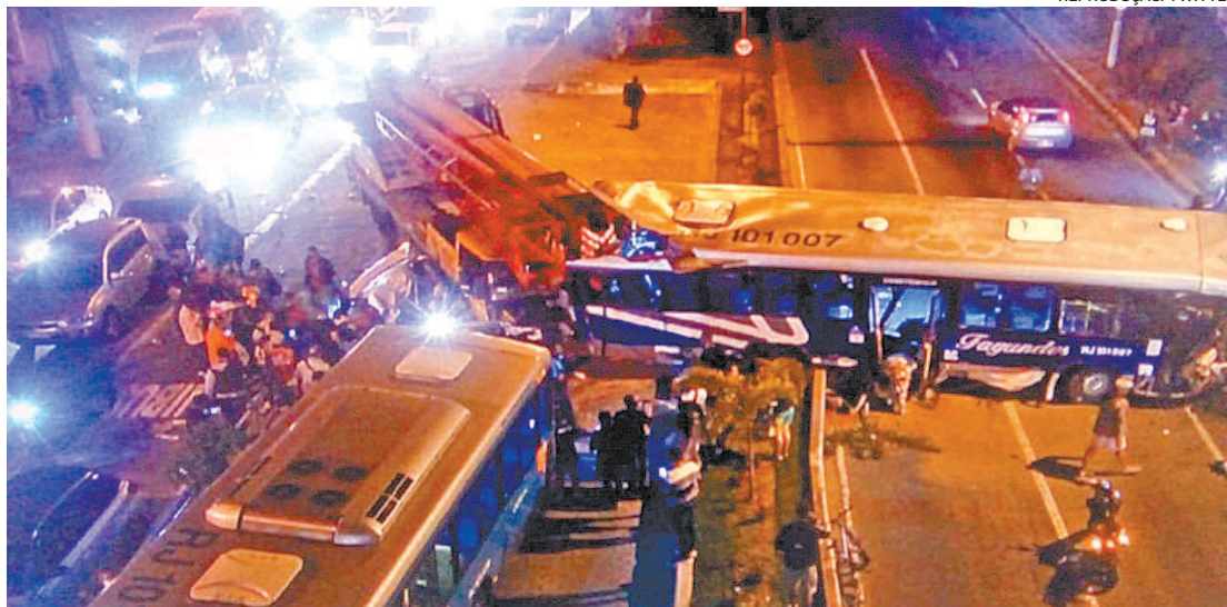
Oito vítimas foram identificadas como leves, três graves e um óbito na Alameda São Boa Ventura

Segundo o Corpo de Bombeiros, os quartéis do 3º GBM (Niterói) e 20º GBM (São Gonçalo) foram acionados para a ocorrência por volta das 18h30. Oito vítimas foram identificadas como leves, três graves e um óbito no local. Os três feridos com maior gravidade já foram removidos do local. Ainda não há confirmação para qual unidade de saúde, mas a expectativa é que todos sejam