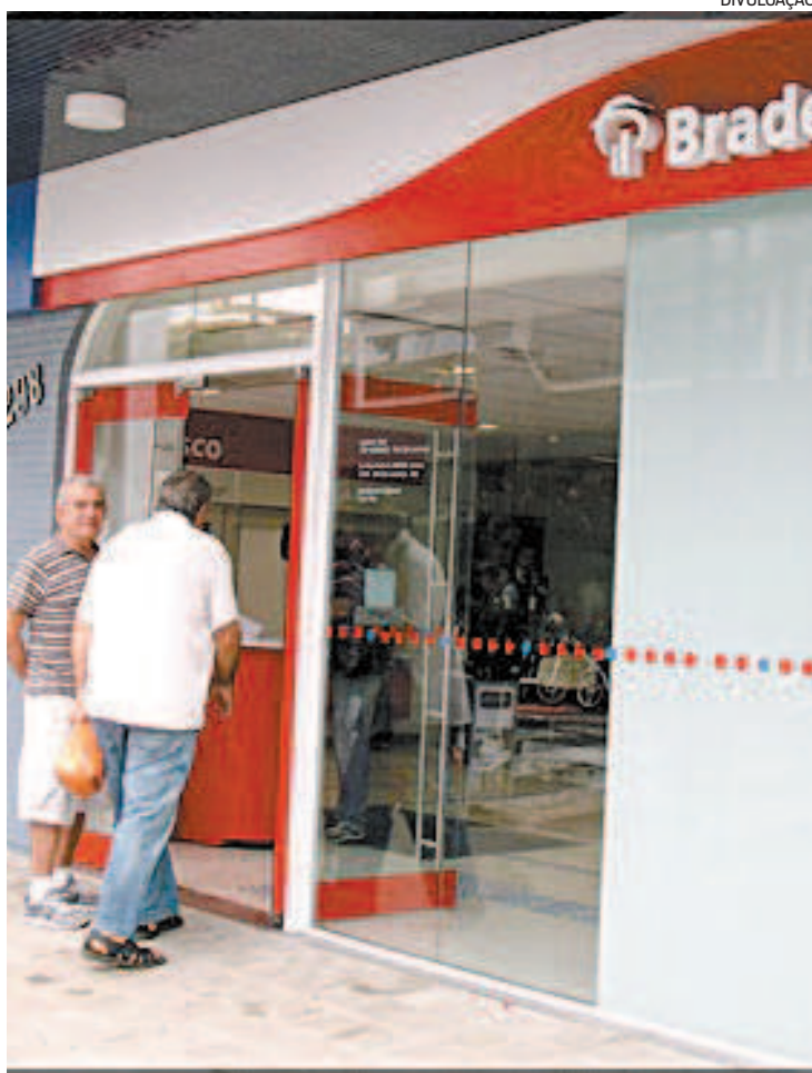
Aposentados poderão fazer o procedimento no autoatendimento

O Rioprevidência não vai exigir a comprovação retroativa para quem nasceu nos meses anteriores a setembro. Para esse grupo a medida passa a valer em 2022. Ou seja, nascidos em janeiro voltarão a fazer o recadastramento no primeiro mês do próximo ano.