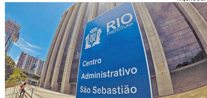
Antecipação será para todos os servidores da Prefeitura do Rio