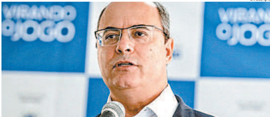
Wilson Witzel diz que pretende revelar “fato gravíssimo” envolvendo o governo federal