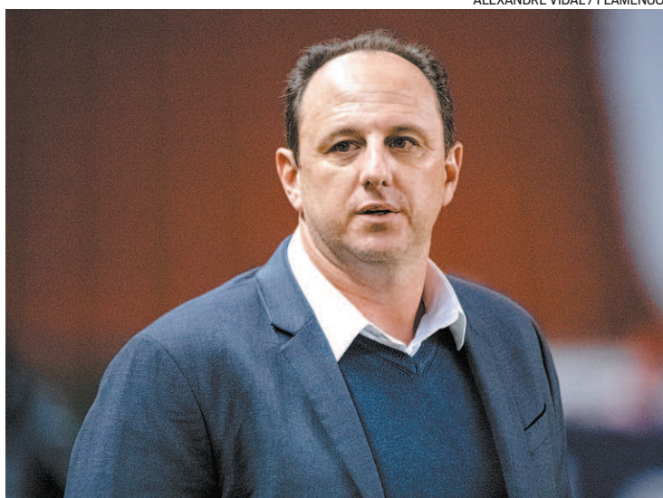
Rogério Ceni enfrenta forte pressão no comando do Flamengo

A equipe vem com uma marca notória e que atrapalha na busca por resultados melhores na competição: inicia o jogo de forma quente, criando chances, mas não consegue definir em gol. Já na segunda etapa, o time de Ceni tem uma queda brusca no rendi-