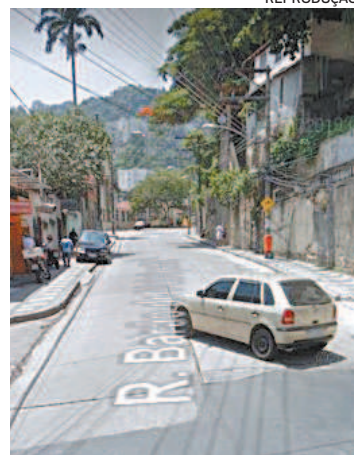
Dia de conflito no Rio Comprido

Nas redes sociais, moradores desabafaram sobre os confrontos na região. “Nós moradores pedimos paz!!!! Até quando vamos viver esse dia de inferno? Morro dos Prazeres pede paaaz!!!”